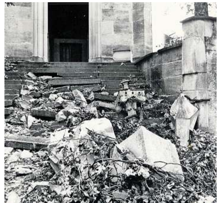
Windböen mit Spitzengeschwindigkeiten von bis zu 285 km/h rissen am 15. August 1982 die Aufrichten von der Andelfinger Dorfkirche.